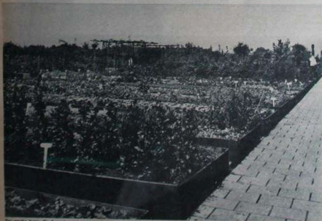
De grote tuin. Er hangt papier voor het bespikken