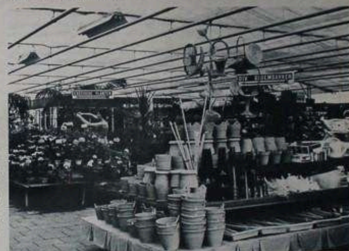
Het interieur van de eerste kas