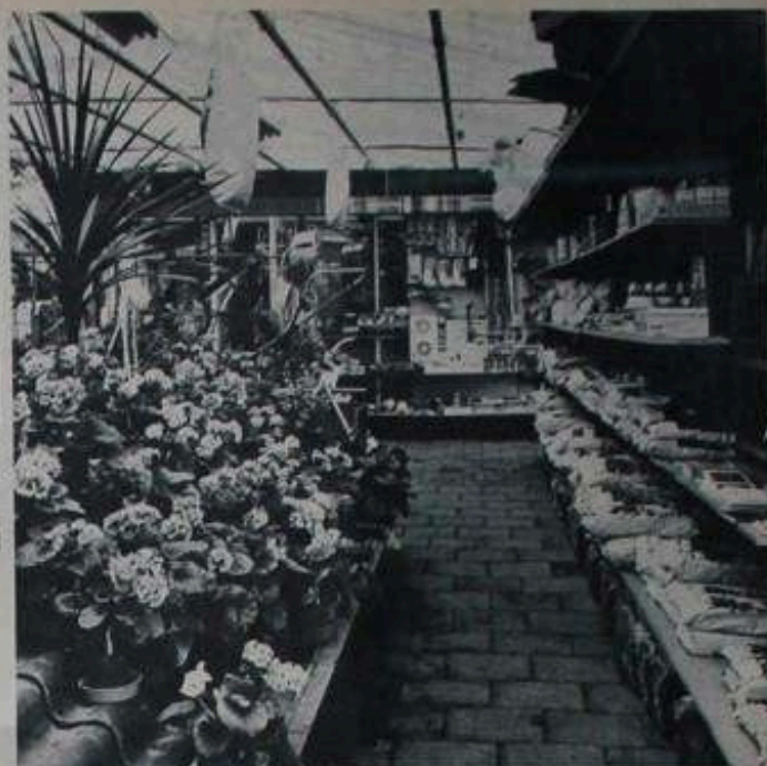
Wand van het kantoorje